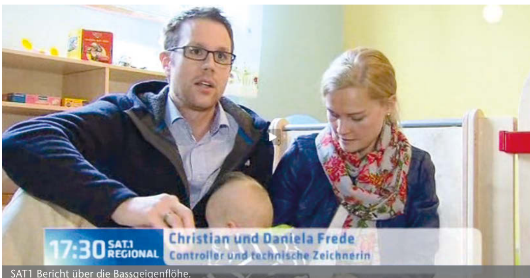
SAT1 Bericht über die Bassgeigenflöhe.