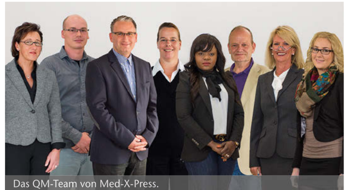
Das QM-Team von Med-X-Press.