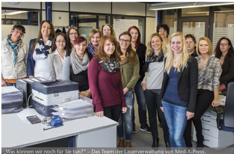
„Was können wir noch für Sie tun?“ – Das Team der Lagerverwaltung von Med-X-Press.