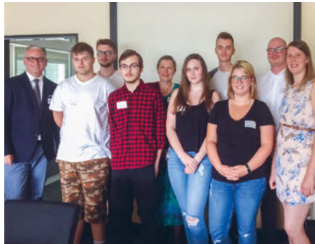
Immer etwas aufregend: der erste Tag.

Erstmals veranstaltete Med-X-Press für die neuen Azubis und deren Eltern diesen Willkommenstag, um das gegenseitige Kennenlernen zu unterstützen und daneben eine Plattform für Fragen zur Ausbildung und zum Unternehmen zu bieten. Begeistert waren davon alle. Der Firmenpräsentation schloss sich ein Rundgang durchs Unternehmen an, der schon mal die Vielfalt des Tagesgeschäfts sichtbar machte. Ausgebildet werden Fachkräfte für Lagerlogistik sowie Kaufleute für Büromanagement.