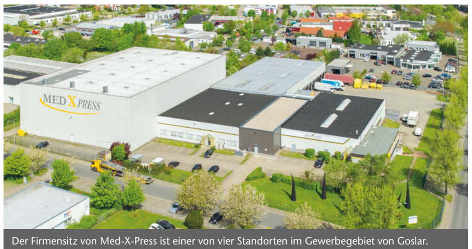
Der Firmensitz von Med-X-Press ist einer von vier Standorten im Gewerbegebiet von Goslar.

Diese qualitativ hochwertigen Dienstleistungen werden von vielen Kunden wahrgenommen und erfolgreich zur Erreichung deren Ziele genutzt. Dies führte in den vergangenen