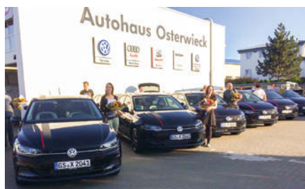
„On the road again“ – die Teamleiterinnen und Teamleiter mit ihren nagelneuen PKW.