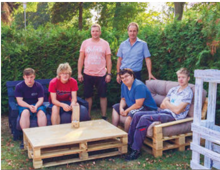
Paletten mal mit anderer tragender Funktion.