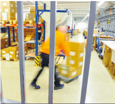
Eines der BtM-Läger bei Med-X-Press.