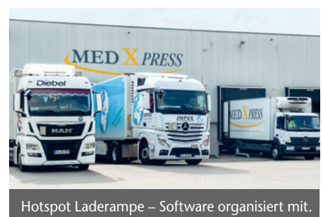
Hotspot Laderampe – Software organisiert mit.

Sie wünschen weitere Informationen? 05321-31130-1420 · info@med-x-press.de