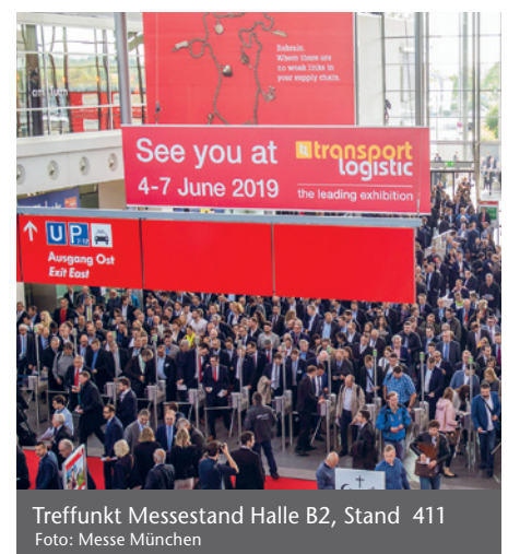
Treffpunkt Messestand Halle B2, Stand 411

Bitte planen Sie Ihren Messetermin schon heute mit Med-X-Press 05321-31130-0 vertrieb@med-x-press.de