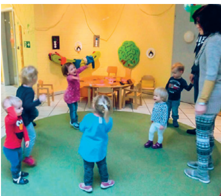
Betreuung für Kids, Entlastung der Eltern.