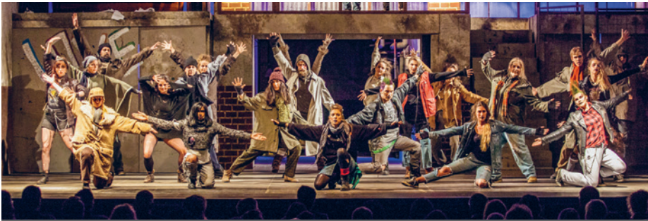
Bühnenreife Auftritte, z.B. mit dem Musical „Rent“