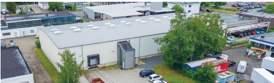
Das Med-X-Press Gebäude in der Straße Lange Wanne, Goslar – über einen separaten Hintereingang gelangt das Theaterteam an den gesonderten Requisiten- und Werkstatttraum.