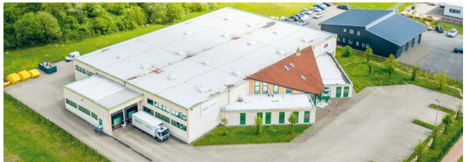
Das Logistik-Lager in der Alten Heerstraße wird komplett an das hohe BtM-Niveau angepasst.

Diese Entwicklungen des Gesamtmarktes für Betäubungsmittel befördern die Nachfrage nach BtM-Dienstleistungen, und die BtM-Logistik von Med-X-Press ist als verlässlicher Outsourcing-Partner gefragt. Med-X-Press reagiert entsprechend und plant den Bau eines