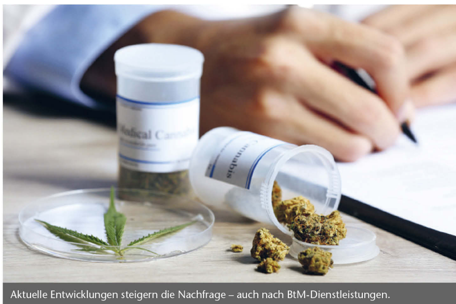
Aktuelle Entwicklungen steigern die Nachfrage – auch nach BtM-Dienstleistungen.

Seit Jahren verzeichnet der deutsche Arzneimittelmarkt einen kontinuierlichen Anstieg bei Betäubungsmitteln. Zudem hat der Gesetzgeber 2017 die Verschreibung von Medizinal-Cannabis unter bestimmten Voraussetzungen erlaubt, sodass die Nachfrage explosionsartig anstieg. Der Weltmarkt für Cannabis ist in Bewegung und der deutsche Markt befindet sich im Fokus internationaler Akteure und Beobachter.