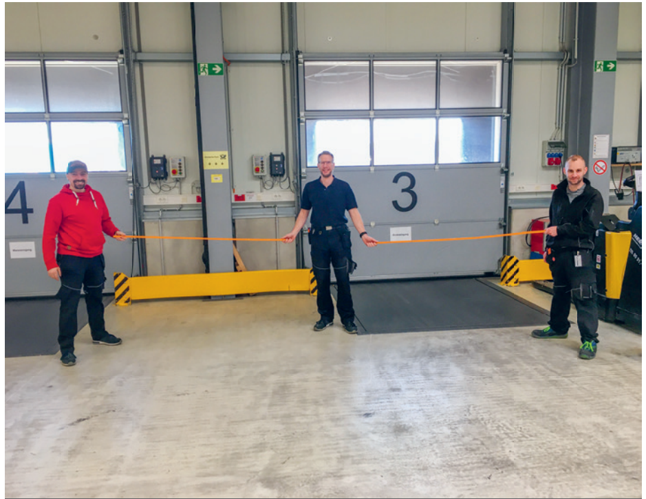
Social Distance – auf den Zentimeter genau, schöne Visualisierung vom Team vom Wareneingang.

Die Versorgungssicherheit für die nationale Arzneimitteldistribution ist lebenswichtig und deshalb systemrelevant. Med-X-Press ist als Pharmalogistiker systemrelevant. Die Herausforderung wurde im Zusammenspiel aller Beteiligten entlang der Supply Chain von Arzneimitteln bestmöglich realisiert.