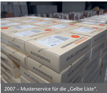
2007 – Musterservice für die „Gelbe Liste“.

Auf die Veränderungen der globalen Pharmamärkte, hat Med-X-Press mit maßgeschneiderten Angeboten reagiert. Um das Kerngeschäft, Lagerung und Distribution , gruppieren sich weitere kundenorientierte Dienstleistungen, die alle den hohen gesetzlichen Auflagen entsprechen. Zum speziellen Angebotsspektrum zählen die Spritzensichtung und die Serialisierung von Arzneimitteln. Im Rahmen der Vorgaben der EU-Fälschungsschutz-Richtlinie investierte Med-X-Press in zwei Serialisierungslinien , die 2019/2020 in Betrieb gingen.