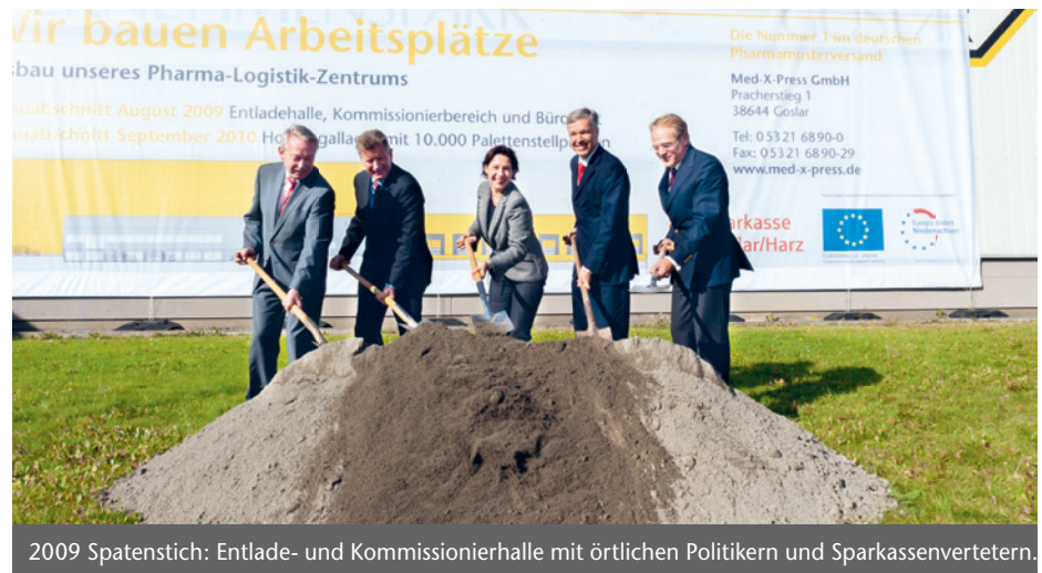
2009 Spatenstich: Entlade- und Kommissionierhalle mit örtlichen Politikern und Sparkassenvertetern.