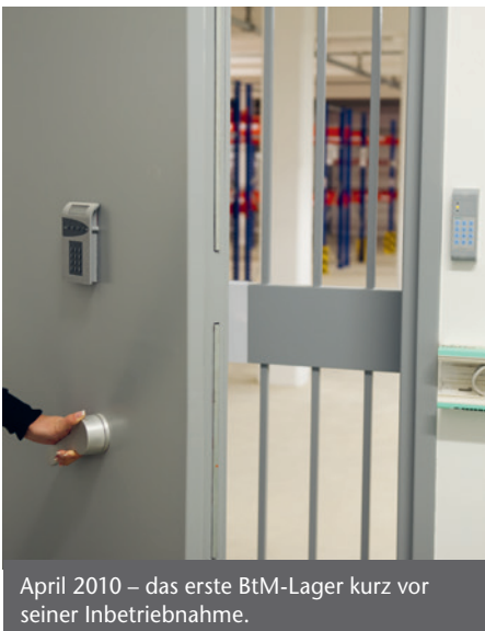
April 2010 – das erste BtM-Lager kurz vor seiner Inbetriebnahme.

„Unser breites Dienstleistungsportfolio ist unser USP im Wettbewerb“