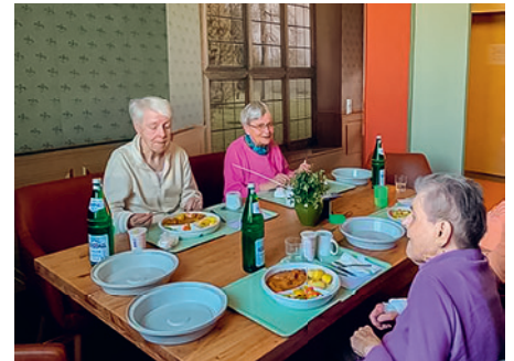
Das Foto entstand kurz vor Ausbruch der Pandemie – das Tragen eines Mund-Nasen-Schutzes ist jetzt in der Klinik Pflicht.

Wir von Med-X-Press arbeiten täglich für die Versorgungssicherheit von Patientinnen und Patienten und haben dieses Projekt von Pflegegeschülern/innen sehr gern unterstützt.