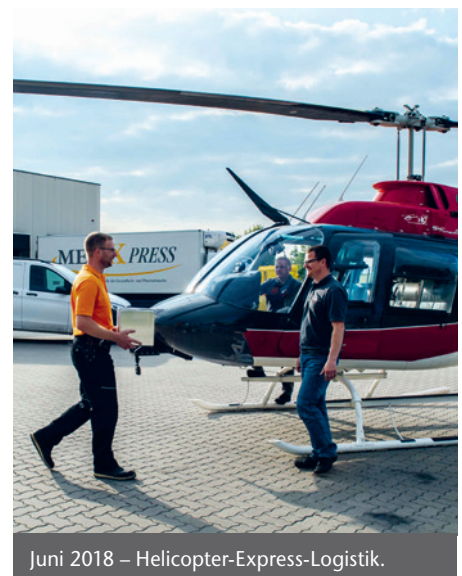
Juni 2018 – Helicopter-Express-Logistik.