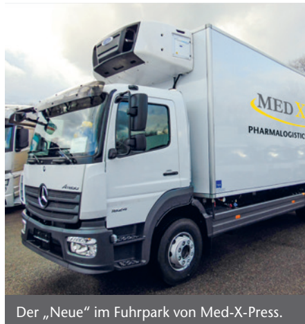
Der „Neue“ im Fuhrpark von Med-X-Press.

Der 16-Tonner bringt 200 kW auf die Straße und bietet Platz für 18 Paletten. Ausgestattet mit moderner Kühltechnik wird der Neue für temperaturgeführte Transporte von Arzneimitteln im Bereich 2 bis 8 Grad sowie 15 bis 25 Grad eingesetzt. So erreicht das sensible Gut seinen Bestimmungsort sicher und gemäß den GDP-Vorgaben.