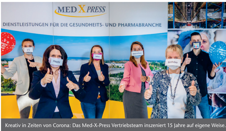
Kreativ in Zeiten von Corona: Das Med-X-Press Vertriebsteam inszeniert 15 Jahre auf eigene Weise.

Zum 15-jährigen Bestehen präsentiert sich die Med-X-Press GmbH, Goslar, als etablierter Pharma-Logistiker, systemrelevant bei der Sicherstellung der Arzneimittelversorgung. Zum Start hatte die „Garagenfirma“ drei Mitarbeitende – heute sind es 330, die für zuverlässige und innovative Dienstleistungen stehen. Ein kombinierter Rück- und Ausblick.